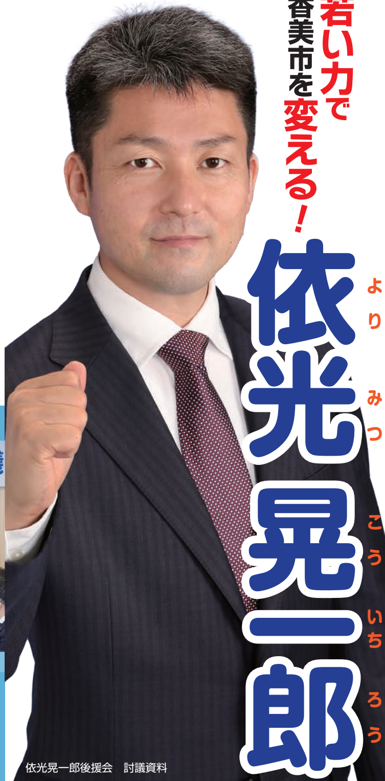
依光晃一郎後援会 討議資料