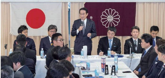
自民党本部で合同会議 平成31年2月9日